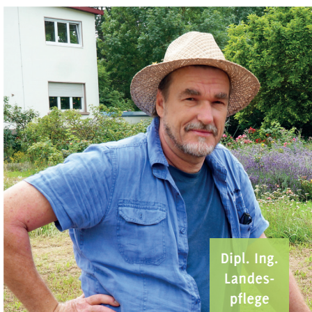
Dipl. Ing. Landes- pflege