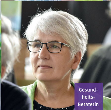
Gesund- heits- Beraterin